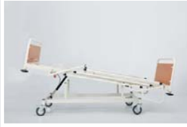
Trendelenburg pozisyonu : 0 - 12°