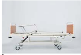
Üst bacak hareketi : 0 - 48°