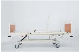
Sırt hareketi : 0 - 65°