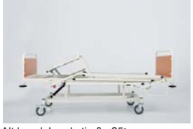
Alt bacak hareketi : 0 - 25°