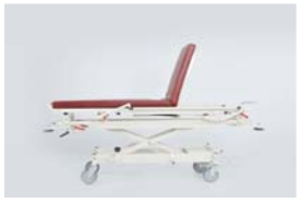
Sırt hareketi : 0 - 65°