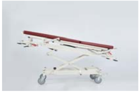
Trendelenburg pozisyonu : 0 - 12°