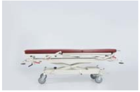
Yatak platformu minimum yüksekliği : 74 cm