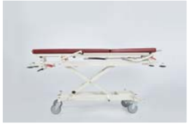
Yatak platformu maksimum yüksekliği : 105 cm