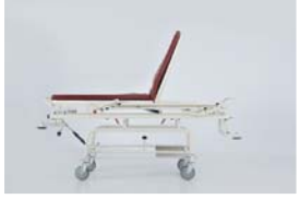
Sırt hareketi : 0 - 70°