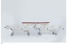
Üst platform bir alt arabadan diğerine kolaylıkla transfer edilebilmektedir.