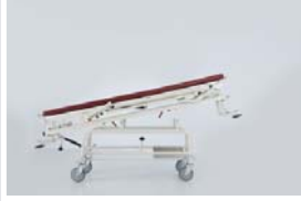
Trendelenburg pozisyonu : 0 - 12°